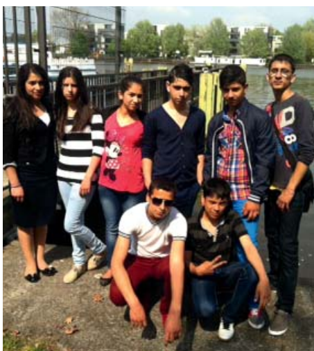
Skupinka mladých účastníků volnočasových aktivit

Berlínský plán vznikl na základě požadavku Evropské unie integrovat Romy jako vůbec první v Německu ve spolupráci různých výborů senátu, jednotlivých městských částí a nevládních organizací. Vzdělání představuje hned první oblast, které se akční plán věnuje. Krom „posvěcení“ činnosti mediátorů a sociálních pracovníků věnujících se romským dětem plán například vyzývá k